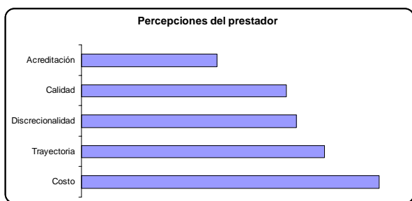
Figura 3 - Prioridades de contratación según los prestadores de alta complejidad